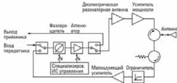
Рисунок 2 – T/R модули являются главными связующими устройствами между антенной РЛС и приёмником. Активные компоненты – фазовращатели и переменные аттенюаторы требуют испытания в нескольких состояниях.

Правильная оценка рабочих характеристик каждого T/R модуля требует целого ряда измерений (рисунок 2). Поскольку T/R модуль является входным устройством приёмника, для него требуется типовой набор измерений, таких как измерение коэффициента шума, частотной характеристики, коэффициента усиления и согласования по входу.