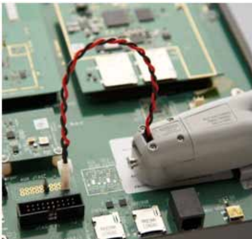
图 4 它附带的先通后断 (MBB) 连接器使您无需焊接或拆焊引线，即可快速地探测被测器件上的多个位置。

该探头可以通过创新的方式连接到被测器件。它附带的先通后断 (MBB) 连接器使您无需焊接或拆焊引线，即可快速地探测被测器件上的多个位置。MBB 探头可以安装到目标电路板上，或用电线连接到被测器件之外。它能够插入到适用于 0.025 英寸方针的 0.1 英寸标准间距的通孔中。用户可相应地设计其 PCB 版图。要想在不中断被测电路的条件下，轻松连接目标电路板上的多个位置或断开与这些位置的连接，MBB 是最好的选择。