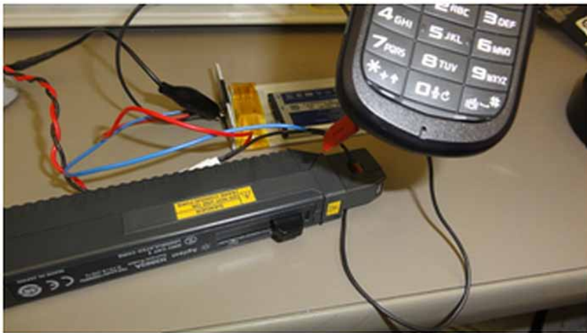
图 2 使用示波器测量电流的最简单方法是使用钳形电流探头，例如 Keysight 1147B 或 N2893A。

而且，为获得更精确的测量，工程师必须不定期地对探头进行消磁处理，以消除探头核心的残余磁性，并补偿钳形电流探头的直流偏置。额外的校准流程会使钳形电流探头更加难以使用。