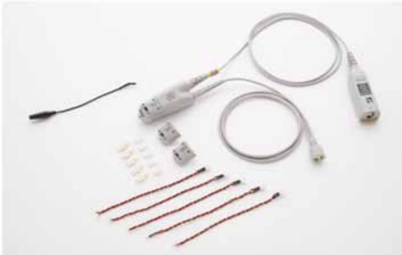
图 3 最新 N2820A/21A 交流 / 直流电流探头提供了示波器电流探头中业界最高的灵敏度。

Keysight N2820A 2 通道高灵敏度电流探头内置两个并联的差分放大器并对它们应用了不同的增益设置，低增益端使您可以查看波形的全貌（或“缩小”视图），而高增益放大器则提供“放大”视图，使您可以查看极其微小的电流波动，例如手机的待机电流。N2820A/21A 电流探头经过优化，可以测量被测器件中的电流流动以表征子电路，从而使用户除了能够查看大信号之外，还能查看快速和大幅变化的电流波形的详细细节。