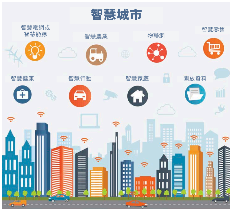
圖 2：LPWAN 技術適合長距離應用，例如智慧城市（交通、停車、空氣品質、設施和排水計量）或醫療應用（門診病人的監測）

接下來要討論的物聯網裝置，其傳輸距離大於上述的 PAN 裝置。多數 IoT 都是上述的短距標準，但也有不少 IoT 應用支援更遠的距離，例如低功率廣域網路（LPWAN），主要應用包括醫療（門診病人的監測）、天然資源（水源品質、石油和礦物萃取）、工業（大型實體工廠的監測和控制）、農業（牲畜健康和定位、天氣、作物健康和用水）、智慧城市（交通、停車、空氣品質、設施和排水計量）、大樓監視等等。這些應用將徹底改變 IoT 的運作，並可為已自動化，但未連接到整合式應用層軟體的工廠，提供即時報告和控制。