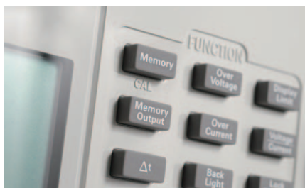
図1. メモリへのセーブ／リコール機能

U8030シリーズは、ニーズに合わせたさまざまな機能と使いやすさを兼ね備えています。LCDディスプレイには1つの画面に電圧と電流の両方が表示されます。また、各出力にオン／オフ・ボタンがあり、複数の出力を同時に制御できます。さらに、自動トラッキング機能により、出力1と2の間の電源電圧シーケンスが簡単にできます。これらの便利で使いやすい機能により、ベンチ用電源として安定した性能を発揮します。